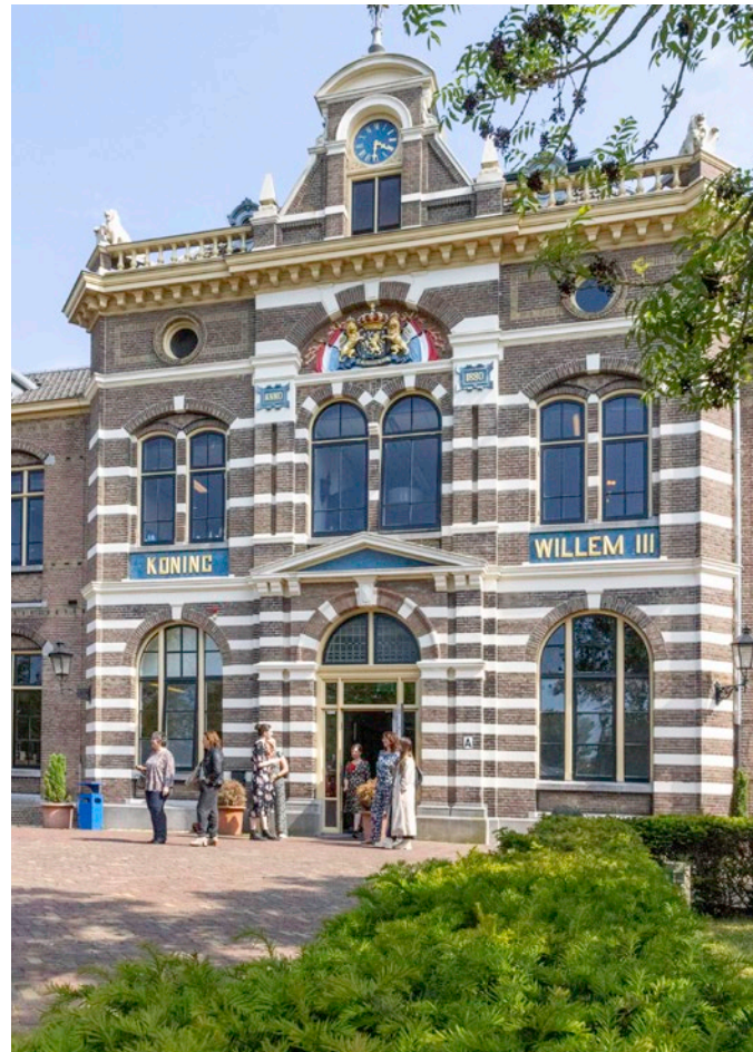
Vergadercentrum Dienst Justitiële Inrichtingen